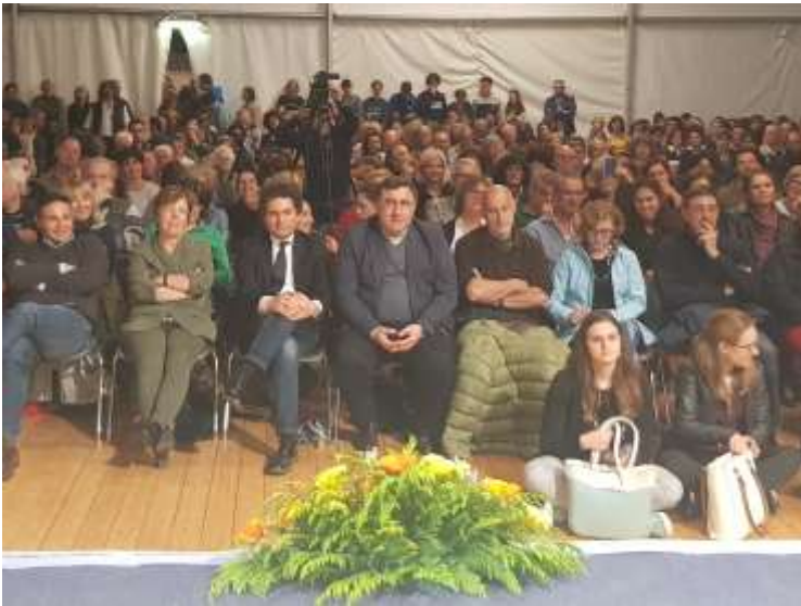
Associazione "Fiera di San Pancrazio"